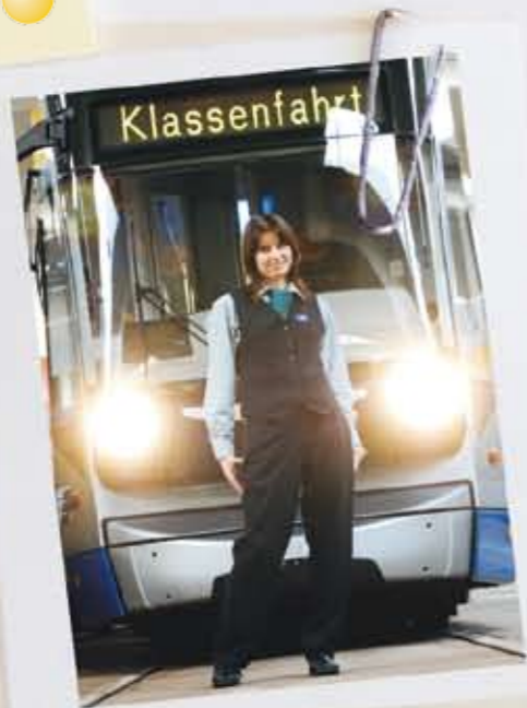
Eine Fachkraft im Fahrbetrieb sitzt selbst am Steuer oder sorgt im Büro dafür, dass Busse und Bahnen rollen.

MEHR INFOS ZUR FACHKRAFT IM FAHRBETRIEB FINDET IHR AUF WWW.BERUFENET.DE ODER AUF WWW.LAB-BILDUNG.DE